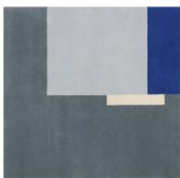
ROQUEBRUNE 1925 - 1935