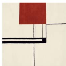
WENDINGEN 1925 - 1935