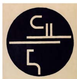
ST. TROPEZ 1925 - 1935